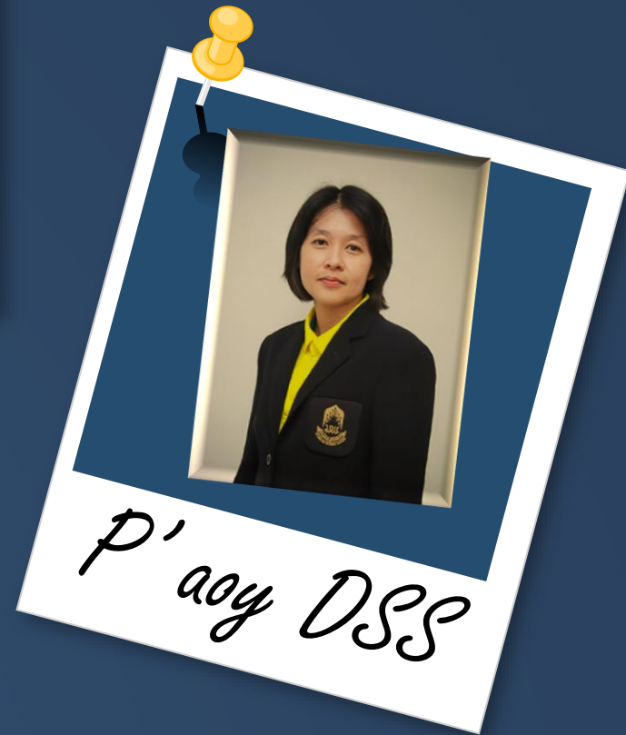
P' Aoy DSS