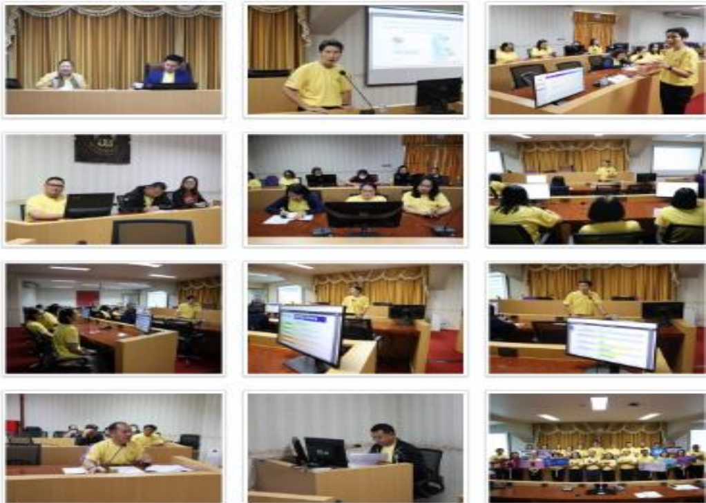
รูปภาพเพิ่มเติมที่ : ประชุมคณะทำงานด้านคุณธรรม ความโปร่งใส และจริยธรรมของกองพัฒนาคุณภาพนิสิตและนิสิตพิการ มหาวิทยาลัยพะเยา ประจำปีงบประมาณ พ.ศ. 2568 : มหาวิทยาลัยพะเยา : กองพัฒนาคุณภาพนิสิตและนิสิตพิการ